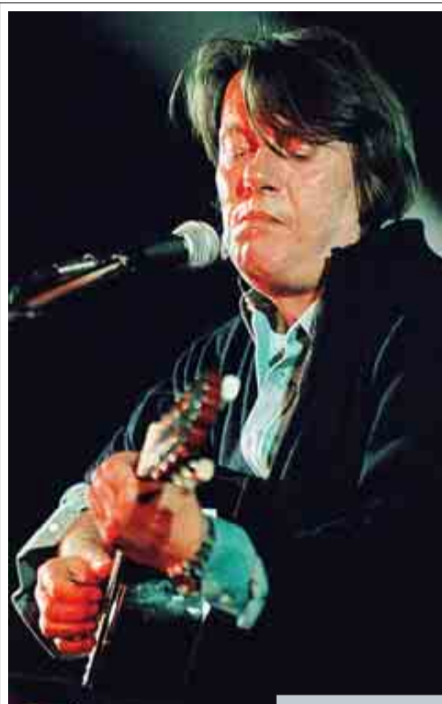
Fabrizio De André